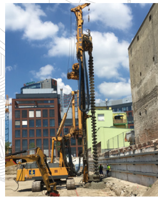
Technologia Mix in Place